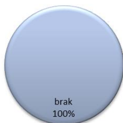
Zatrudnienie w formie telepracy