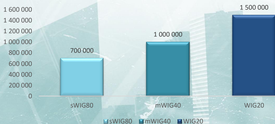
Wykres. Mediana wynagrodzeń menedżerów w spółkach zaliczanych do indeksów WIG20, mWIG40 i sWIG80 (osoby pracujące cały 2017 rok)