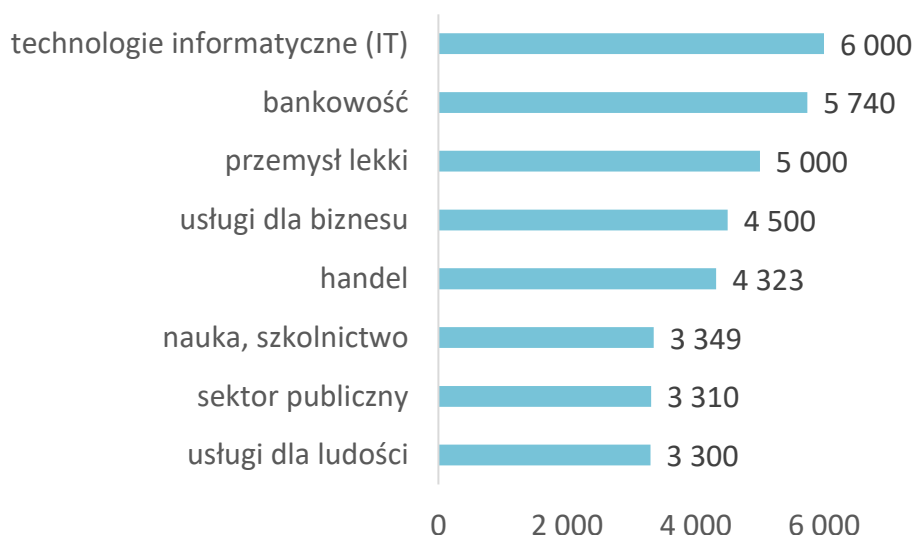
Wykres 1. Mediany wynagrodzeń absolwentów publicznych uniwersytetów pracujących w wybranych* branżach w 2016 roku (brutto w PLN)