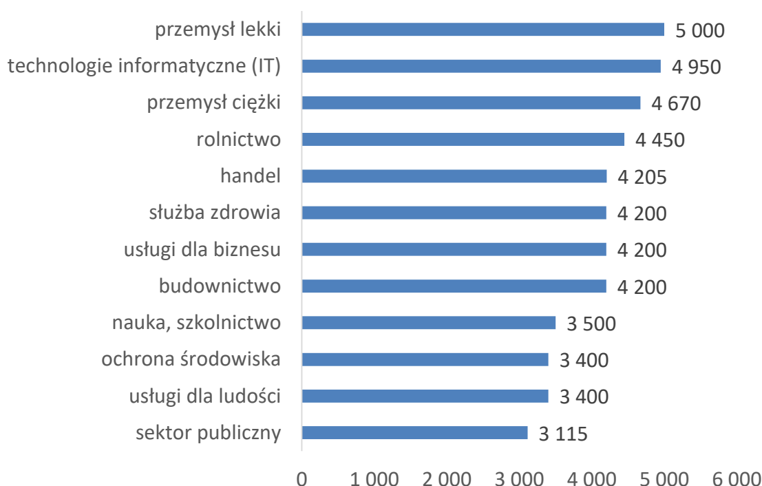
Wykres 1. Mediany wynagrodzeń absolwentów uczelni rolniczych i przyrodniczych pracujących w wybranych branżach w 2016 roku (brutto w PLN)