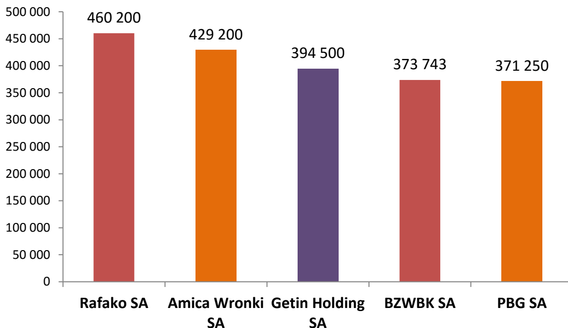
Wykres 3. Spółki z najwyższym średnim wynagrodzeniem w radach nadzorczych w 2015 roku (spółki, które wypłaciły wynagrodzenia za cały 2015 rok przynajmniej trzem członkom rady nadzorczej, dane w PLN)