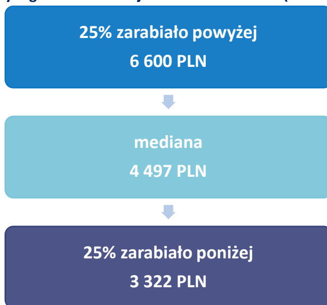
Schemat 1. Wynagrodzenia w Trójmieście w 2017 roku (brutto w PLN)

Jak wynika z Ogólnopolskiego Badania Wynagrodzeń, mediana wynagrodzeń całkowitych brutto w 2017 roku dla trzech miast wyniosła 4 497 PLN brutto. Dla porównania mediana dla Polski wyniosła 4 157 PLN brutto, z kolei dla Warszawy 5 645 PLN brutto.