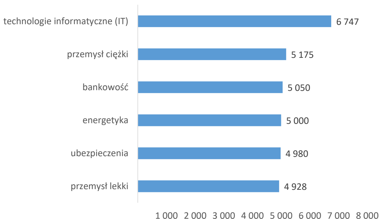
Wykres 1. Wynagrodzenia w Trójmieście w 2017 roku w wybranych branżach (brutto w PLN)