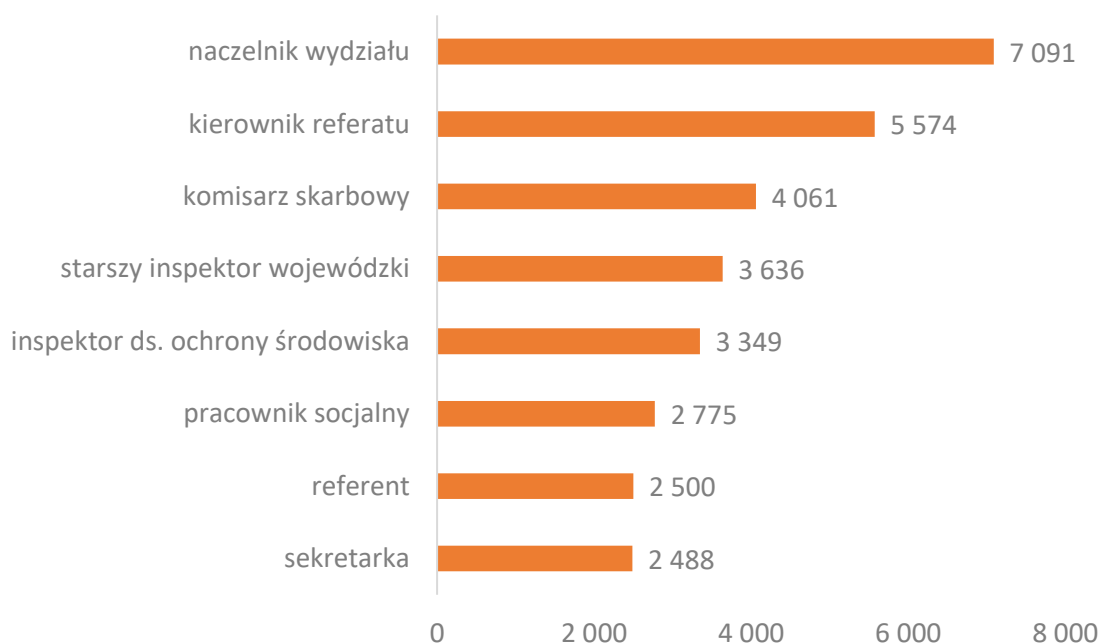
Wykres 2. Mediany miesięcznych wynagrodzeń całkowitych na wybranych stanowiskach w 2017 roku (brutto w PLN)

W raporcie prezentujemy stawki wynagrodzeń dla 57 stanowisk. Na poniższym wykresie możecie Państwo zobaczyć mediany dla wybranych spośród nich.