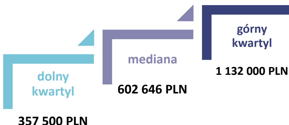
Schemat 1. Roczne wynagrodzenia menedżerów spółek notowanych na GPW (osoby, które przepracowały cały 2017 rok)

Źródło: Opracowanie Sedlak & Sedlak na podstawie raportu: „Wynagrodzenia członków zarządów w 2017 roku”