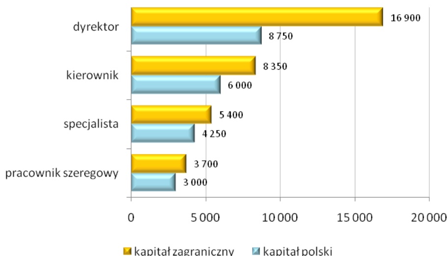
Wykres 1. Wynagrodzenia informatyków w firmach o różnym kapitale