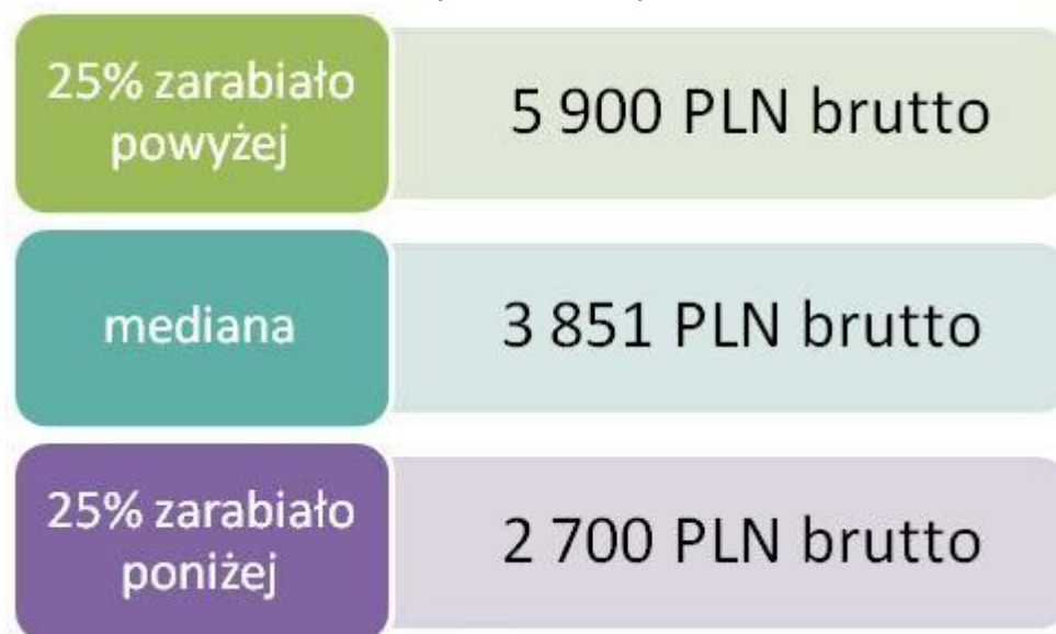
Schemat 1. Wynagrodzenia w organizacjach pozarządowych w 2014 roku (brutto w PLN)