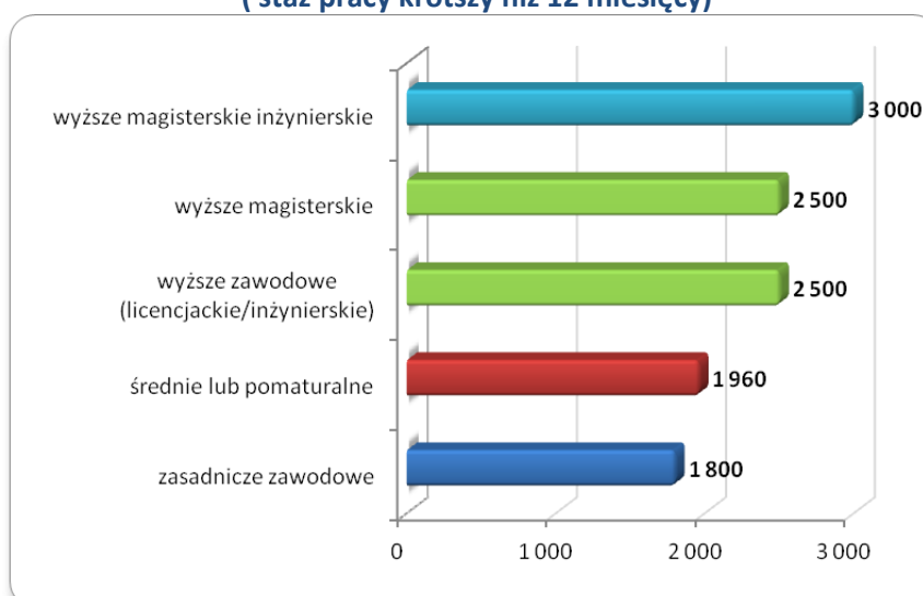
Wykres 1. Mediana wynagrodzeń całkowitych brutto osób o różnym wykształceniu ( staż pracy krótszy niż 12 miesięcy)

Źródło: Ogólnopolskie Badanie Wynagrodzeń (OBW) przeprowadzone przez Sedlak & Sedlak w 2012 roku