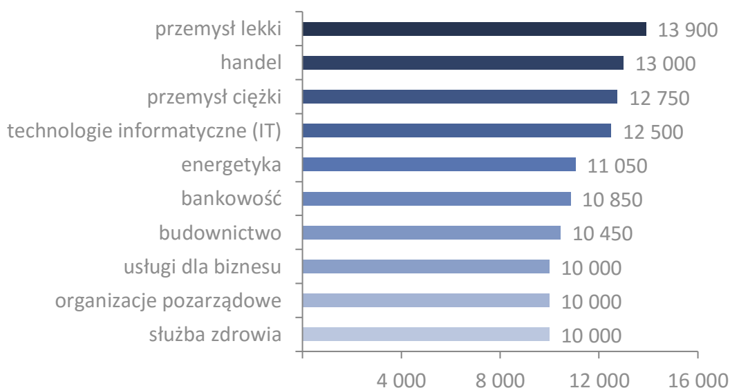
Wykres 2. Miesięczne wynagrodzenia całkowite osób posiadających MBA zajmujących stanowiska kierownicze i dyrektorskie w 2016 roku (brutto w PLN)