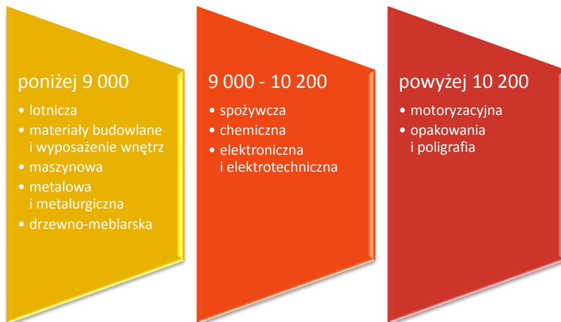
Schemat 1. Wynagrodzenia całkowite kierowników w różnych branżach (mediany, PLN)

Opracowanie własne na podstawie Raport Płacowy Sedlak & Sedlak 2016